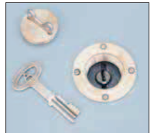
Cerraduras de cilindro con llave

Las cerraduras de detención proporcionan acceso al interior y exterior mediante llave y son ideales para establecimientos correccionales y otras edificaciones que requieren un nivel máximo de seguridad. Para mayor seguridad y hermeticidad contra la intemperie, se accede a la cerradura desde el exterior a través de una placa de cubierta roscada y provista de un empaque. Las escotillas de techo Bilco pueden prepararse para la instalación in situ de muchas cerraduras de marcas líderes.