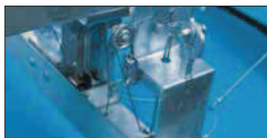
Respiraderos para Explosiones