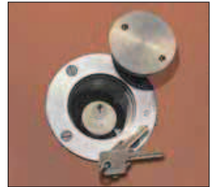
Cerraduras de cilindro con llave

Las cerraduras de cilindro con cerrojo permiten el acceso al exterior mediante llave y acceso al interior mediante llave o perilla giratoria. Las cerraduras de cilindro brindan una mejor seguridad que es ideal para muchas aplicaciones. Para una mayor seguridad y hermeticidad contra la intemperie, se accede al cilindro de la cerradura desde el exterior a través de una placa de cubierta roscada provista de un empaque.