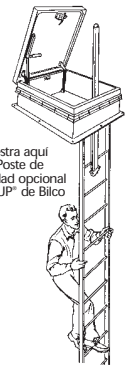
Se muestra aquí con el Poste de Seguridad opcional LadderUP® de Bilco